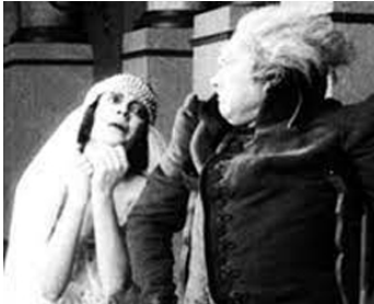
1922 LA NOCE AU PIED DE LA POTENCE (Vánina) d'A. von Gerlach avec Paul Wegener