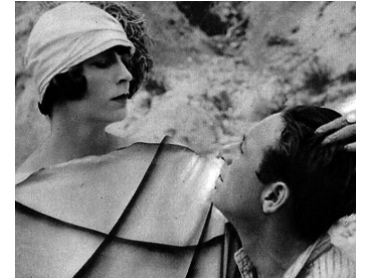
1922 L'ABÎME (Der Absturz) de Ludwig Wolff avec Gregori Chmara