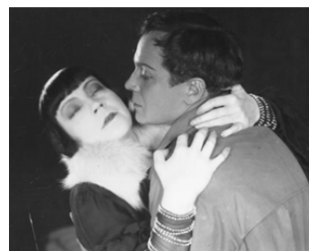
1927 L'ANGE DANGEREUX (Das gefährliche Alter) d'Eugen Illes avec Walter Rilla