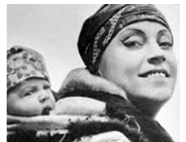
1917 L'ENFANT ESQUIMAU (Das Eskimobaby) de Walter Schmidhässler avec F. Wingardh