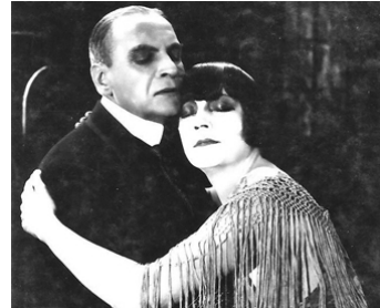
1922 LOULOU (Erdgeist) de Leopold Jessner avec Albert Bassermann