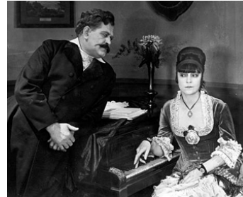
1923 HEDDA GABLER (Hedda Gabler) de Franz Eckstein avec Albert Steinrück