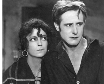
1923 LA MAISON PRÈS DE LA MER (Das Haus am Meer) de Fritz Kaufman avec Carl Auen