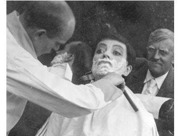
1912 JEUNESSE EN FOLIE (Jugend und Tollheit) d'Urban Gad avec Hans Mierendorff