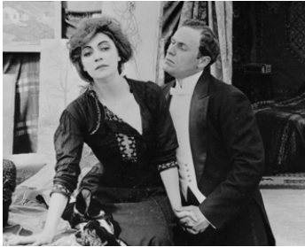
1911 AMOUR DE DANSEUSE (Balletdanserinden) d'August Blom avec Valdemar Psilander