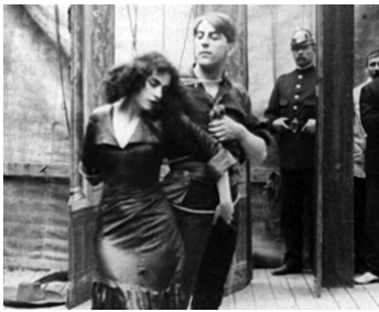
1910 L'ABÎME (Abgrunden) d'Urban Gad avec Robert Dinesen