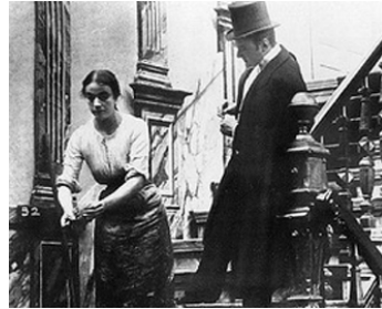
1912 PAUVRE AMOUR (Die arme Jenny) d'Urban Gad avec Leo Peuckert