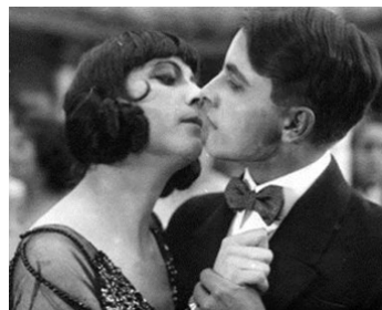
1914 ROSES BLANCHES (Die weißen Rosen) d'Urban Gad avec Valdemar Psilander