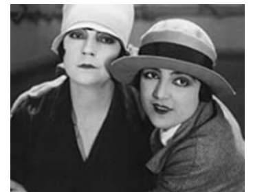
1926 SOUCIS FÉMININS (Gehetzte Frauen) de Richard Oswald avec Carmen Boni