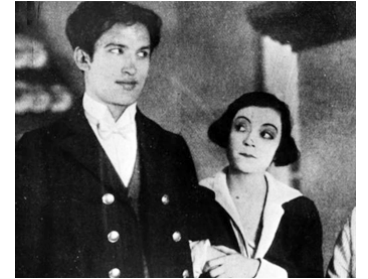
1921 MADEMOISELLE JULIE (Fräulein Julie) de Felix Basch avec Wilhelm Dieterle