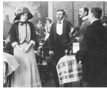
1911 PAPILLON DE NUIT (Nachtfalter) d'Urban Gad avec Heinrich Peer