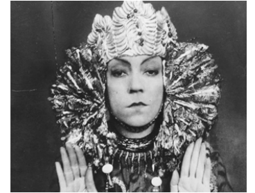
1924 LES BOUDDHAS VIVANTS (Lebende Buddhas) de Paul Wegener