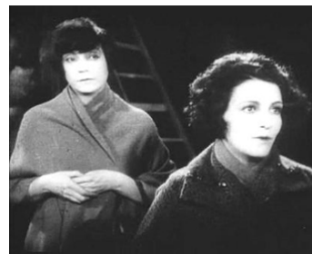
1925 LA RUE SANS JOIE (Die feudlose Gasse) de Georg Wilhelm Pabst avec Greta Garbo