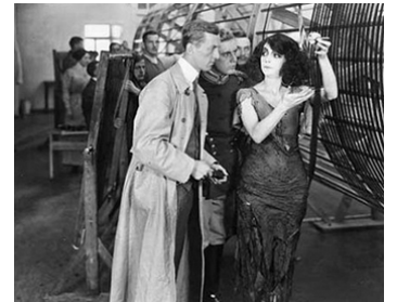
1913 LA PREMIÈRE DAME DU CINÉMA (Die Filmprimadonna) d'Urban Gad avec Paul Otto