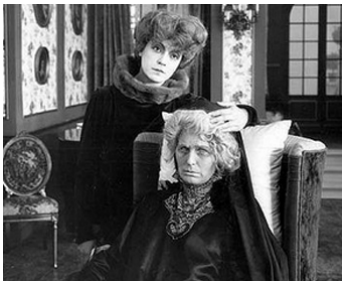
1918 MOD LYSET (Mod Lyset) d'Holger-Madsen avec Astrid Holm