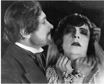
1920 ÉTAT D'ÂME (Irrende Seelen) de Carl Froehlich avec Walter Janssen