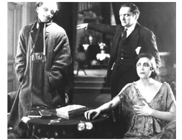
1919 LA RONDE (Der Reigen ein Werdegang) de R. Oswald avec Th. von Loos, Conrad Veidt