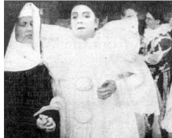
1912 LES COMÉDIENS (Komödianten) d'Urban Gad