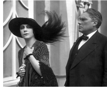
1921 LE BIEN-AIMÉ ROSWOLSKY (Die geliebte Roswolskys) de F. Basch avec Paul Wegener