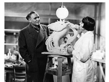
1932 AMOUR IMPOSSIBLE (Unmögliche Liebe) d'Erich Waschneck avec Hans Lehmann