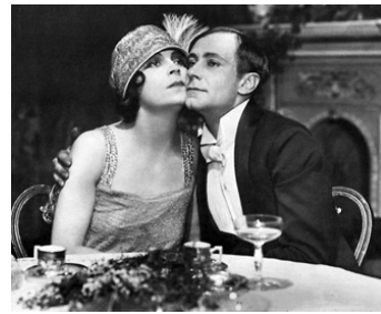
1919 IVRESSE (Rausch) d'Ernst Lubitsch avec Alfred Abel