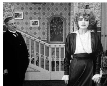
1916 L'ABC DE L'AMOUR (Das liebes ABC) de Magnus Stiffer avec Ludwig Trautmann