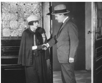
1924 LA BATAILLE DES PAPILLONS (Die Schmetterlings Schlacht) de F. Ekstein avec R. Schünzel