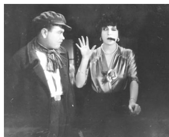
1927 LA TRAGÉDIE DE LA RUE (Dirnentragödie) de Bruno Rahn avec Oskar Homolka