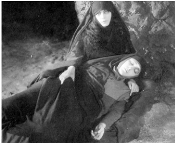
1923 I.N.R.I. (I.N.R.I. ein Film der Menschlichkeit) de Robert Wiene avec Henny Porten