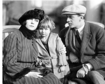
1922 LA DANSEUSE NAVARRO (Die Tänzerin Navarro) de L. Wolff avec Alexander Granach