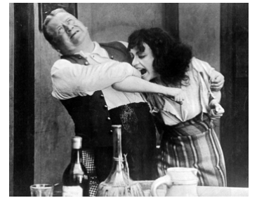
1911 SANG GITAN (Zigeunerblut) d'Urban Gad avec Gunnar Helsingreen